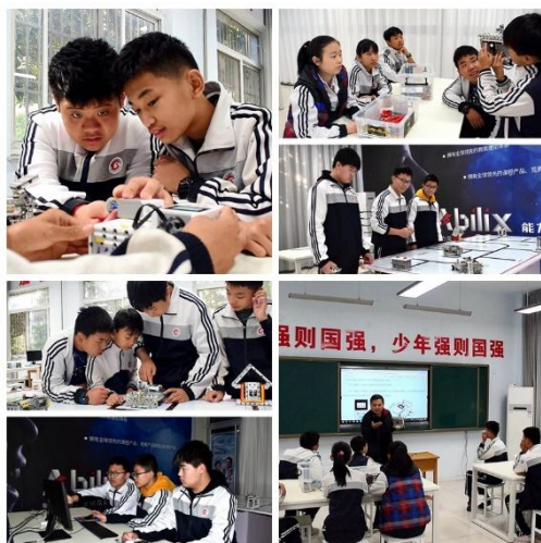
淄博市2022年教育技术装备应用创新案例获奖名单

近年来，学校高度重视智慧校园建设，不断提高教育信息化应用水平，积极推进教育装备与教育教学深度融合，为培养学生核心素养、促进学生全面发展提供有效支持。